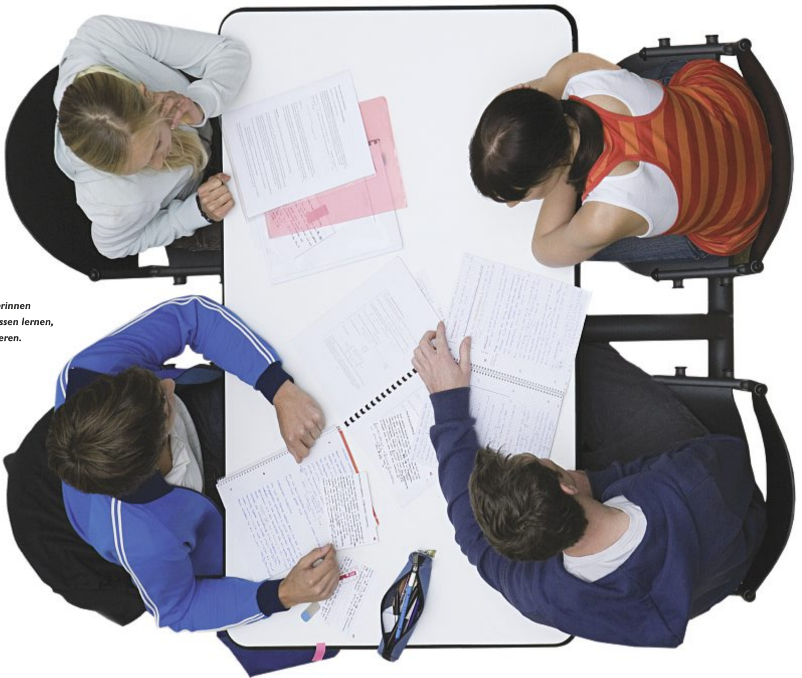
Kritische Wissenschaftlerinnen und Wissenschaftler müssen lernen, miteinander zu kooperieren.