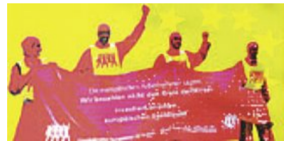
Für ein soziales Europa: EGB/DGB-Demo 16. Mai 2009 Berlin